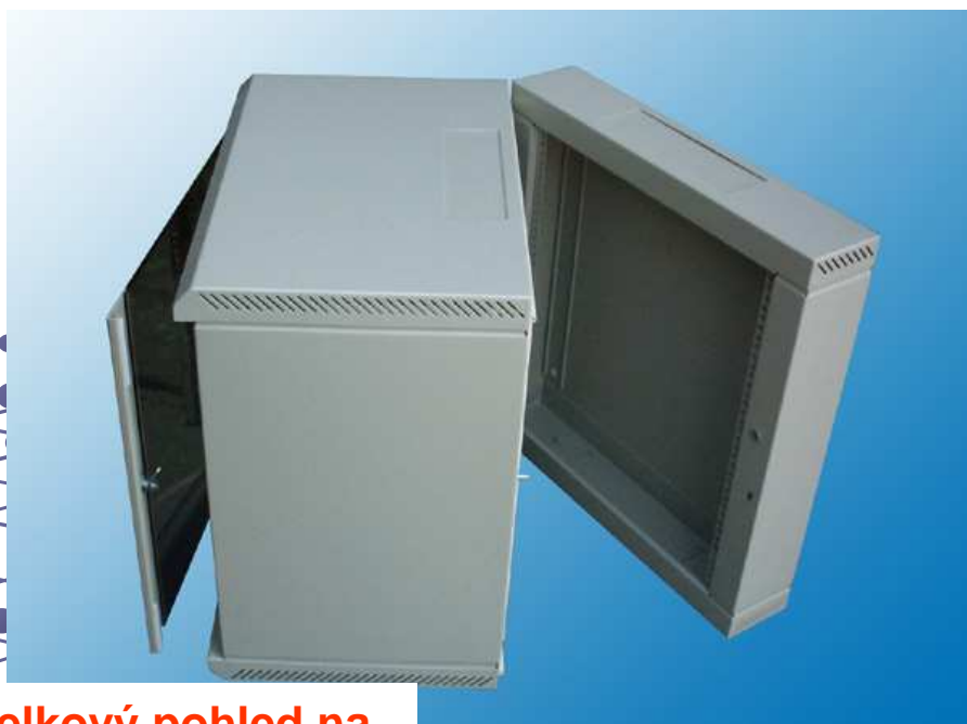
Celkový pohled na dělený závěsný rozvaděč